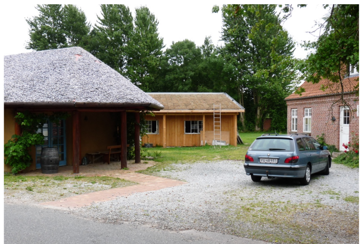
For yderligere orientering: Google, halmhuset vin.

Efter aftale er I velkomne til at låne et toilet.