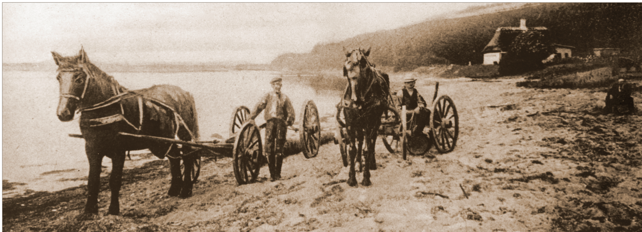
Hestetrukne blokvogne transporterer kævler på stranden ved Fiskerhytten, Sønderskoven ved Sønderborg. Omkring år 1900

SKLA står for "Sønderborg Kommunes Lokalhistoriske Arkivsamvirke", der er en organisation, valgt af kommunens lokalhistoriske arkiver samt Arbejderarkivet i Sønderborg og Danfoss Historiske Arkiv.