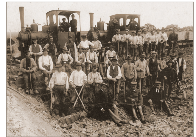
Fotografier venligst udlånt af Ulkebøl Lokalhistorisk Arkiv, April 2016