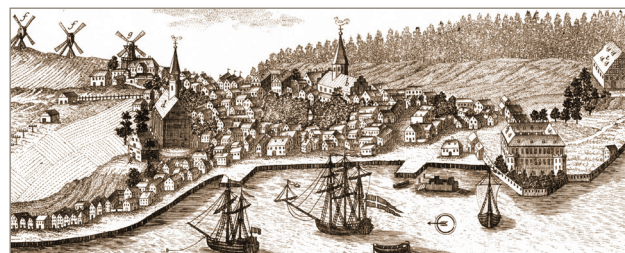
Sønderborg Kommunes Lokalhistoriske Arkivsamarbejde

Ulkebøl Lokalhistorisk Arkiv Torvet 12, Ulkebøl, 6400 Sønderborg Tlf. 7442 9366 | ulkeboel.arkiv@bbsyd.dk